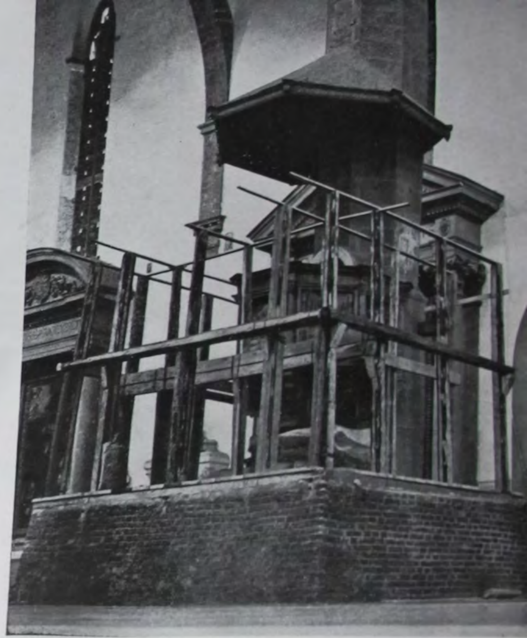
FIRENZE - Chiesa di Santa Croce. Lavori di protezione dell'acquasantiera di Antonio Rossellino e del pulpito di Benedetto da Maiano.